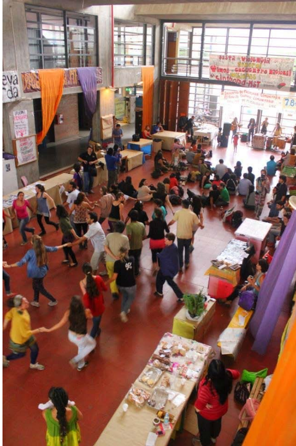
Bondi en encuentros de Psicología Comunitaria UNC Cba Nov, 2013