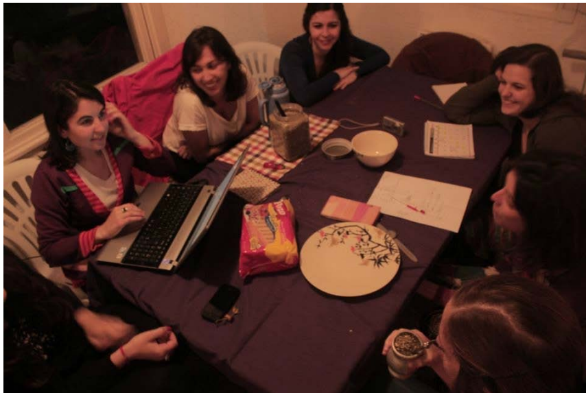
Bondi en reunión de equipo