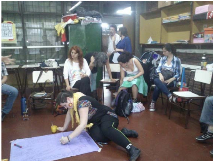
Bondi en Preencuentro de Psicología con Mesa de Psicología Comunitaria del Área