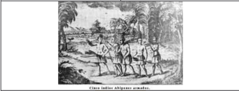
Cinco indios Abipones armados.