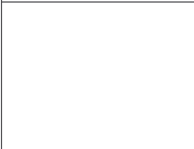
Misión de TIMBO, según un dibujo de Dobrizhoffer