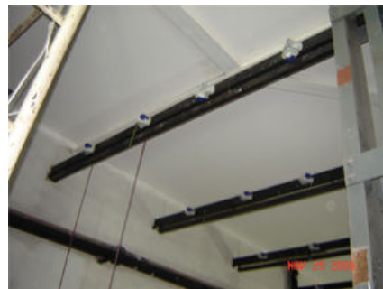
Sistema audio: inst. eléctrica y cableado