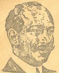
JOSE INGENIEROS (1887 - 1925)

Nacido en Buenos Aires y graduado en su Facultad de Medicina, intelectual y espiritualmente procedía de la era misma del siglo XIX. Superado el romanticismo, buscó por la investigación y el experimento el secreto de las cosas, la explicación de las ideas y la justificación del hombre. Escritor fecundo, animador de la juventud, anatemizó la mediocridad, exaltó las fuerzas morales y creyó hasta el postrer día de su precaria existencia en la efectividad de nuevos y más dignos días para la humanidad. De su variada y nutrida obra científica, filosófica y literaria la EDITORIAL TOR ha publicado hasta la fecha: