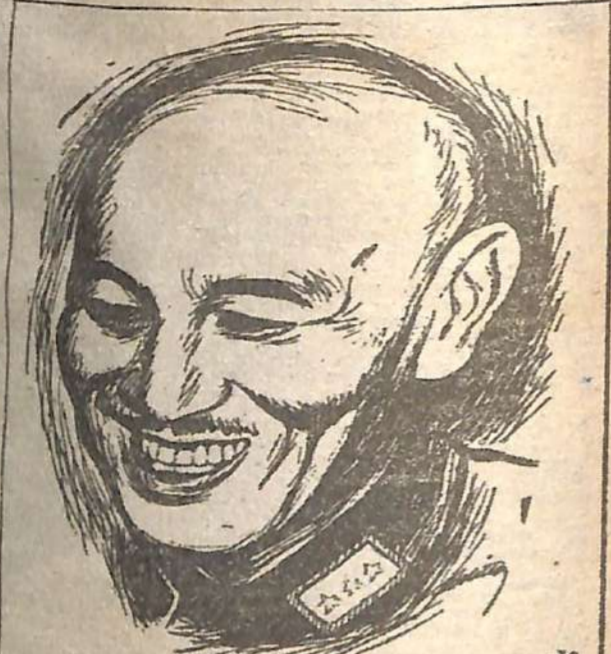
El Mariscal Chiang Kai Shek, el hombre de rasgos suaves y ojos oblicuos habituado una de cada cinco personas de las que existen en la tierra

El embajador Pat Hurley, el viejo y hábil diplomático que ha estado tratando últimamente de llevar la influencia oriental de Chiang dentro de su propia vida, dijo recientemente: "Mire, gente que dicen que es usted algo muy poco distinto a un dictador, y apere."