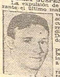
LOUSTAU es de repetir sus brillantes actuaciones últimas.