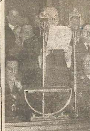
DELEGADOS colombianos que asistirán a la IIIa Conferencia de Radiocomunicaciones de Rio de Janeiro, fotografiados ayer a su paso por esta capital. Preside la delegación el ministro de Correos de Colombia

Con la presunta renuncia del doctor Benítez se ha relacionado el anuncio del coronel Perón, jefe de la fuerza de estudiantes del país, y en el cual anuncia la derogación del decreto por el que se exoneró a numerosos profesores.