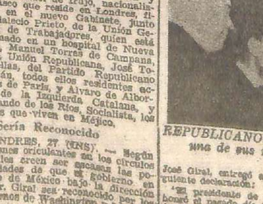
REPUBLICANOS españoles en una de sus reuniones.