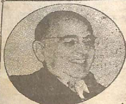
DON GETULIO Vargas, quien volvería a ser presidente del Brasil según las versiones que circulan en Brasil