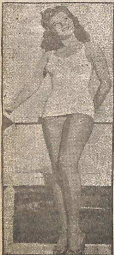
IMPECABLE. - Este es el calificativo que mereció Rosemary La Plunche, "Miss América 1945". La fotografía demuestra elocuentemente que el jurado dió su fallo a conciencia.