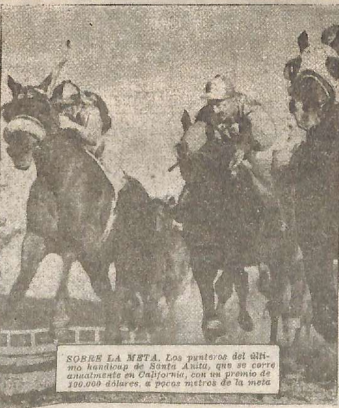
SOBRE LA META. Los punteros del último handicap de Santa Anita, que se corre anualmente en California, con un premio de 100.000 dólares, a pocos metros de la meta