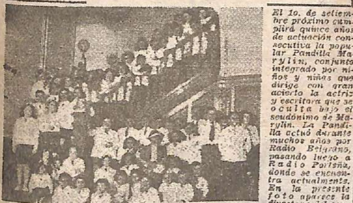
En la foto, cada uno por los pequeños integrantes de la Pandilla...