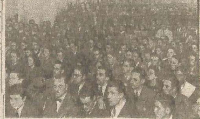
ASPECTO PARCIAL que ofrecía la concurrencia, durante el acto realizado para clausurar la huelga universitaria

El Consejo de la Administración Nacional del Agua, adoptó en su última sesión, varias resoluciones de interés general relacionadas con los servicios a su cargo con respecto a diversas obras en el interior del país. Oficializó la cañería distribidora de agua existente en la calle Avellaneda, entre las de Bernardo de Irigoyen y Aristobulo del Valle, de la ciudad de Mar del Plata. Fijóse plazo hasta el 31 de diciembre próximo, para que los propietarios de fincas del Distrito San Isidro, situadas con frente a las nuevas cañerías distribidoras de agua, procedan a instalar los respectivos servicios domiciliarios. Aprobó, por último, el proyecto y presupuesto de $ 4.800.000, relativo a la construcción de las redes colectoras de líquidos cloacales en Lomas de Zamora y Temperley (Prov. de Buenos Aires), cuya realización se dispone efectuar por vía administrativa, a fin de acelerarla y evitar la cesantía de personal.