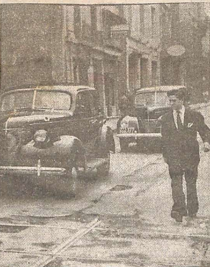
TRAMPAS. - Los pavimentos de casi todas las calles céntricas se encuentran en estas condiciones. Presentan baches que constituyen verdaderas trampas para los vehículos. Automóviles que van a parar a ellos, salen con las cubiertas, los ejes o los elásticos rotos