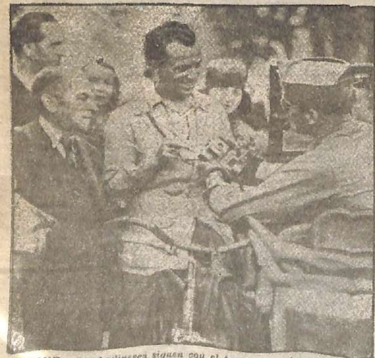
TRUQUE. - Los berlineses siguen con el truque. Aquí vemos a uno de ellos dando una cámara fotográfica por un paquete de cigarrillos a un oficial norteamericano. El cable informa que transacciones como estas son habituales en la ciudad ocupada.