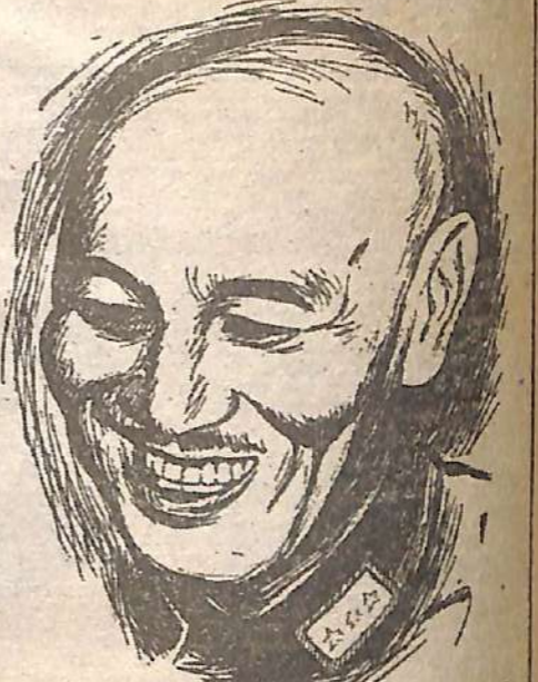
EL MARISCAL Chiang Kai Shek, el hombre de rasgos suaves y ojos oblicuos, a quien gobierna un tercio de cada cinco personas de las que existen en la tierra

CHUNGKING (NS). — Una de cada cinco personas de las que existen en el llamado Chiang-Kai-Shek. Generalísimo de la mayoría de los ejércitos chinos, cabeza del gobierno nacional de China, ministro de varias carteras, Chiang está hoy de 450.000.000 de chinos.