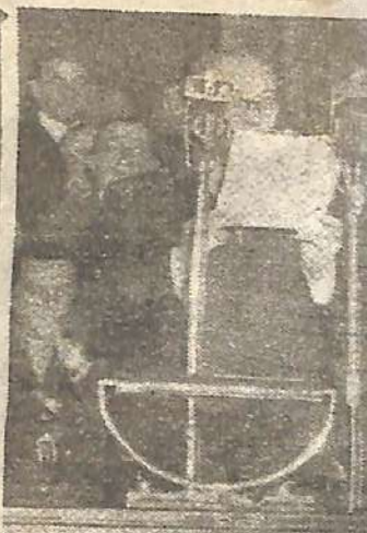
DELEGADOS colombianos que asistieron a la III. Conferencia de Telecomunicaciones de Río de Janeiro, fotografiados ayer a su paso por esta capital. Preside la delegación el ministro de Correos de Colombia.

LA PLATA, 28 (C.). — En el día de ayer tuvo lugar la anunciada reunión de rectores en el edificio que ha creado una universidad de carácter público. Las autoridades universitarias se reunieron en un momento de expectativa para la sesión que se celebró hasta la Casa de Gobierno. El resultado de la reunión fue la aceptación de la renuncia del actual ministro y la designación de un nuevo titular.