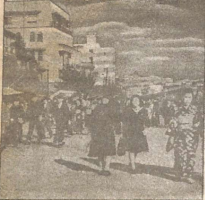
ES OCUPADA. — Aspecto que ofrecían no hace mucho tiempo las calles de la capital del Mikado, que ha comenzado a ser ocupada por tropas aerotransportadas. El cable informa que estas iniciaron su descenso en los aeródromos próximos a la ciudad