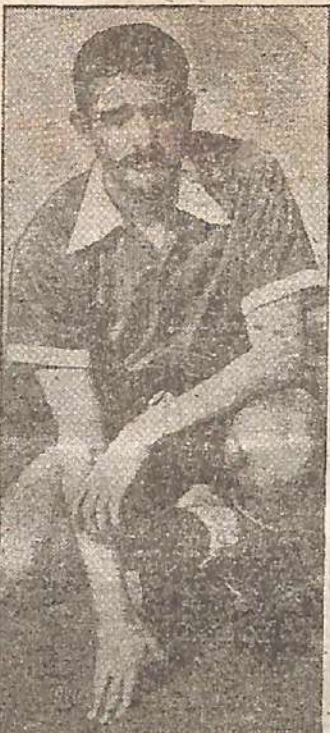
VIENENTE De la Mata notable insidioso de Independiente...